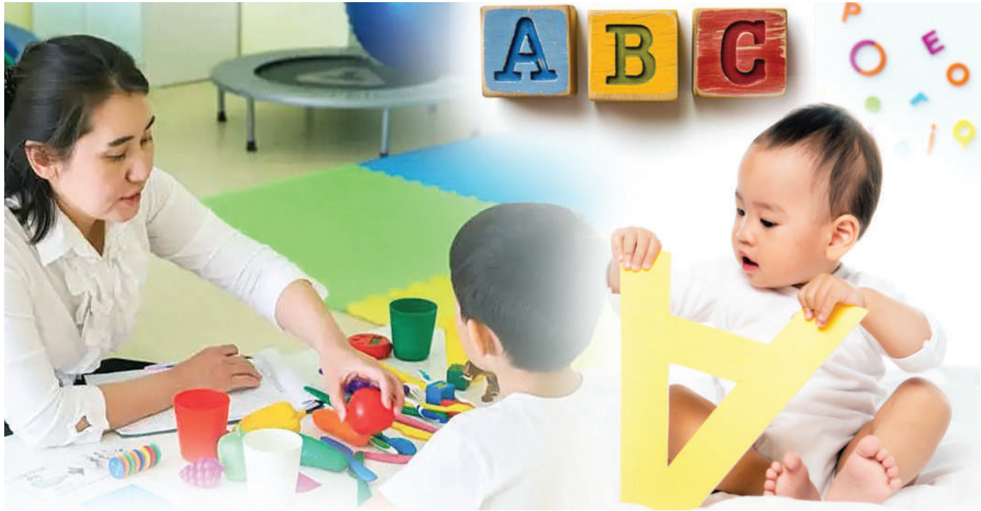
ЕЛАП ҚАБА (КОЛАЖ)

– Сәбиге жарық дүние есігін ашқаннан бөксік жырын айту қажет. Бұл баланың есту қабілетімен қатар, түйсігін де дамытады. Бөксік жырында жуан-жіңішке, еріндік-езулік, ашық-қысаң, қатан-ұяң, үнді сынды дыбыстардың барлық түрі қамтыған. Әрбір дыбыс түрін есту арқылы бала анық сөйлеуге бейімделеді. Сондай-ақ баламен көп әңгімелесу арқылы да оны еркін сөйлеуге дағдыландыруға болады.